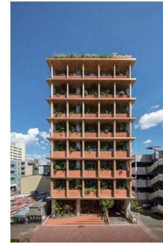
竣工: 2021 用途: 自社オフィス (改修)