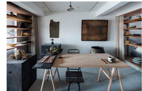
竣工: 2016 用途: 専用住宅 マンション一室改修