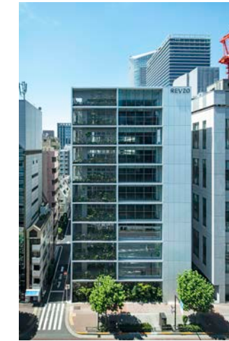
竣工: 2020 用途: テナントオフィス