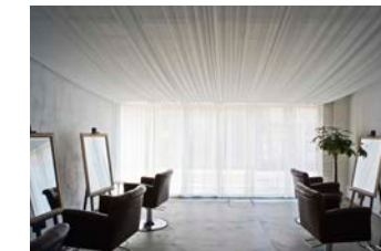
竣工: 2013 用途: 店舗 (ヘアサロン)