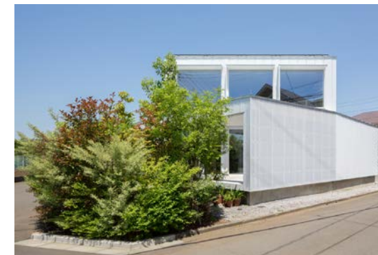
竣工: 2016 用途: 専用住宅