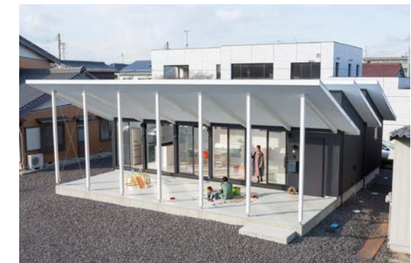
竣工: 2017 用途: 専用住宅