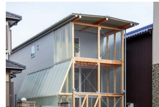
竣工: 2022 用途: 専用住宅