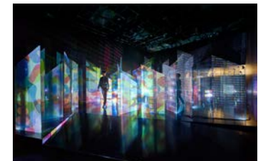
竣工: 2015 展示: ミラノサローネ 2015 他