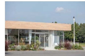
竣工: 2021 用途: 店舗 (ヘアサロン)